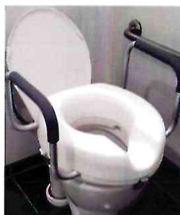
■ Насадка на унитаз

Общероссийская общественная организация «Всероссийское общество инвалидов с ампутацией конечностей и иными нарушениями функций опорно-двигательного аппарата «Опора»