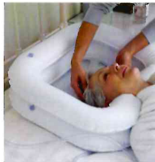
■ Ванна для мытья головы