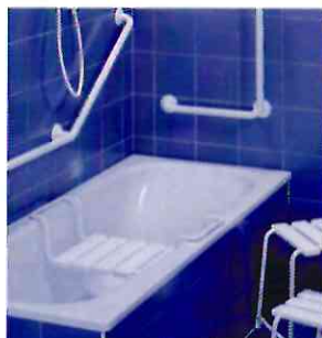
■ Сиденье для ванны