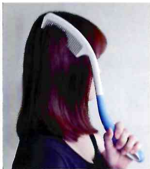
■ Расческа с длинной ручкой