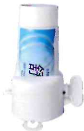
■ Захват для тюбика зубной пасты